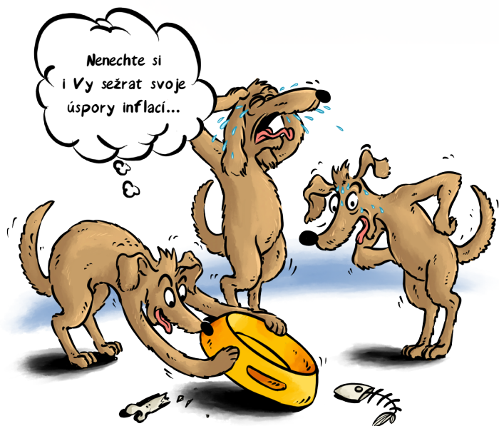
ČÁSTKA NA BĚŽNÉM ÚČTĚ, ČI DOMA 100.000,-

V prvním čtvrtletí roku 2022 se očekává meziroční inflace k 8%, možná až k 10%. Potom ekonomové předpokládají, že by inflace mohla klesat. Pro ochranu financí proti inflaci dnes existuje řada nástrojů. Ať jsou to různé typy dluhopisů, nemovitostní fondy či komodity. Rádi vám v tom poradíme.